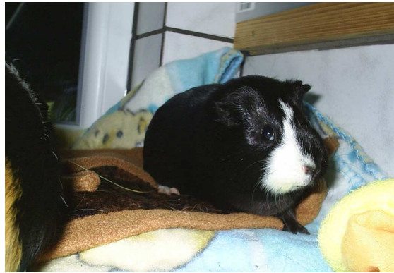
Juli / August 2012